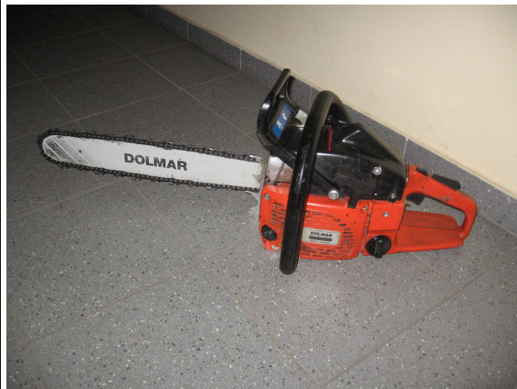
aktuelle Motorsäge vom RW-1