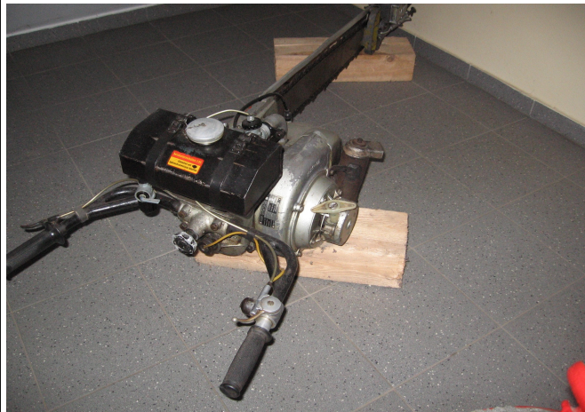
Zwei-Mann-Motorsäge aus früherer Zeit – Ausstellungsstück